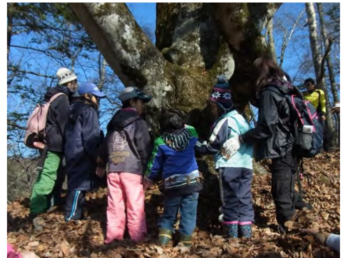
(乙女高原のブナじいさん)